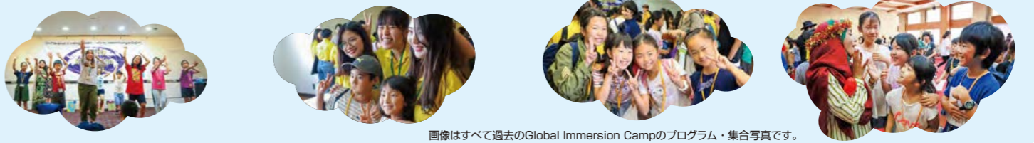
画像はすべて過去のGlobal Immersion Campのプログラム・集合写真です。

※施設の都合上、募集定員を以上のようにさせていただきます。※現地、会場事情や天候その他のため、変更する場合があります。 ※旅行会社添乗員は同行しません。※募集型企画旅行の責任範囲は施設入場から施設退場までとなります。 ※公正式英語学習者でなく、英検®/TOEFL Primary®/TOEFL Junior®を未受験で、同等の英語力がある方は公文教育研究会 グローバルネットワークチームまでお問い合わせください。 【お申込について】 先着50名までは申込完了時に参加確定となります。51名からは、募集締切後、定員を超えた場合は抽選となります。(結果は6月10日(月)ごろにメールでご連絡いたします。) 先着枠でキャンセルが出た場合、抽選枠の申込順で繰り上げ抽選となります。