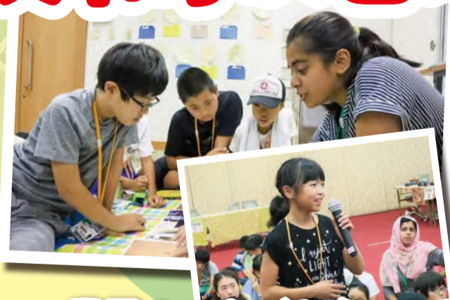
世界のできごとを 学ぶ