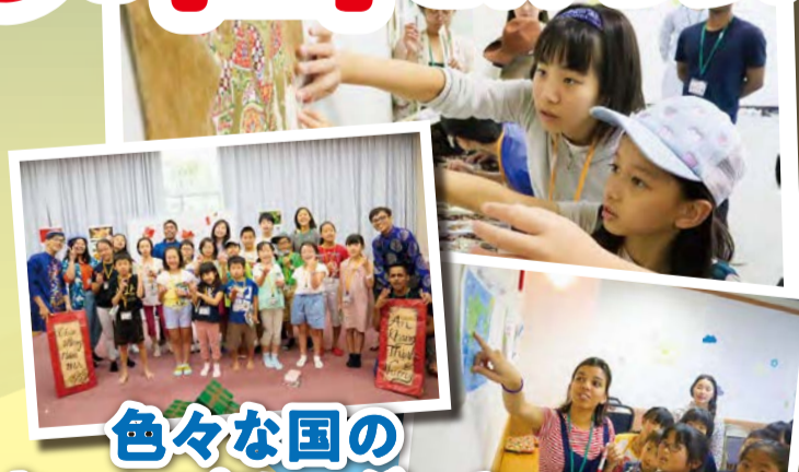
色々な国の キャンプリーダーと 異文化交流