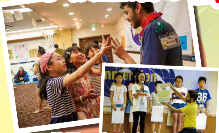
英語でたくさんの コミュニケーション